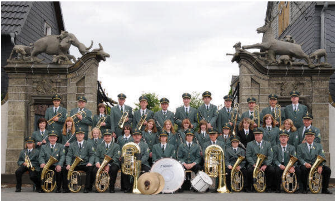
Foto der Musikkapelle Hirschberg im Sommer 2008