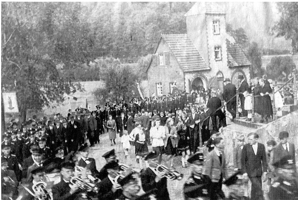
Ein Zeitungsausschnitt aus dem Jahre 1948 beim Feuerwehrfest in Allagen zeigt am unteren Bildrand die Musikkapelle Hirschberg