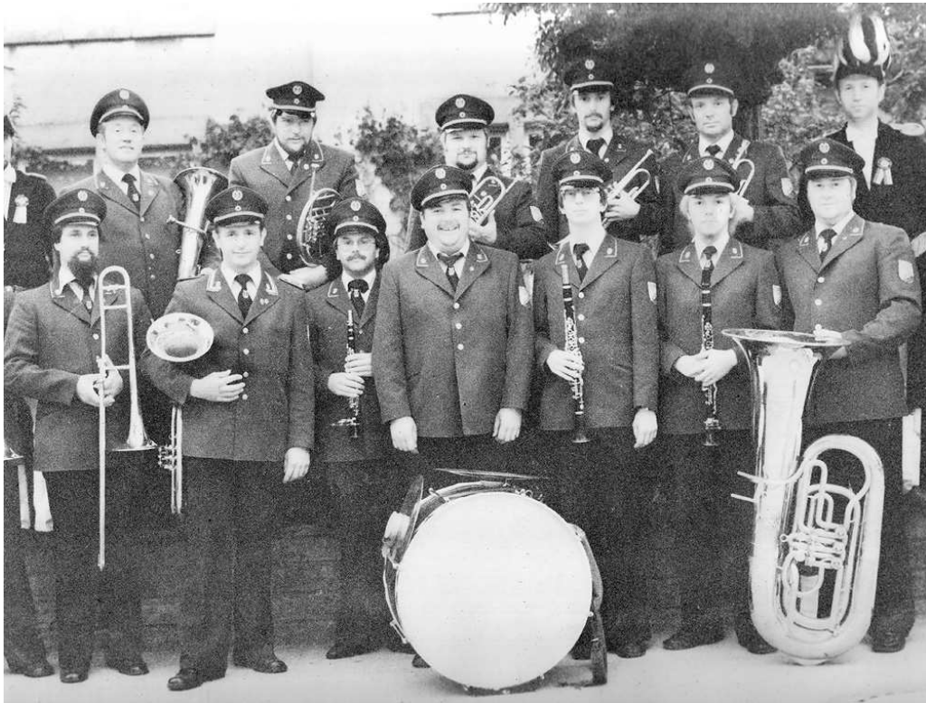
Foto von einem Schützenfest in Effeln ca. 1970